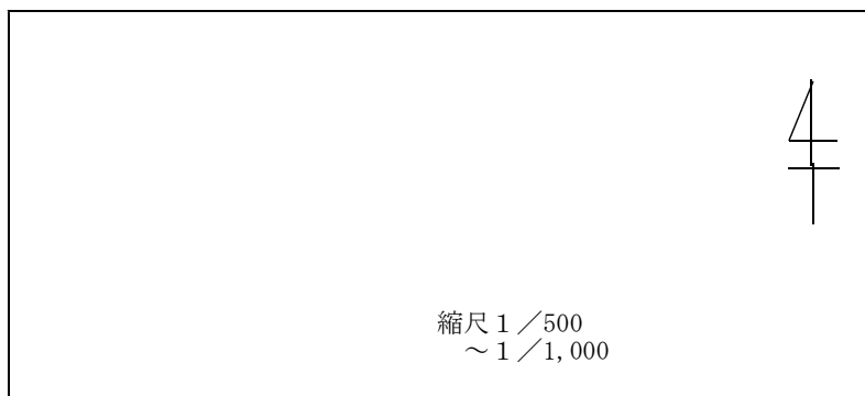
生産施設、緑地、緑地以外の環境施設、その他の主要施設の配置図