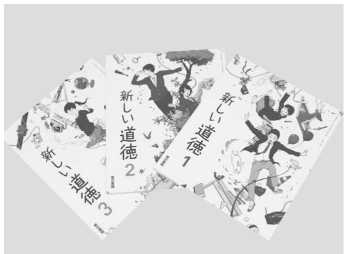
教科化された道徳

園長 西こども園は217名の園児がいますので給食の問題とか、多少の心配な所はあるようです。できる限り話を聞いて、しっかり対応し解消に努めています。