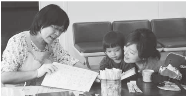
1歳6か月児健診の様子

妊娠期から子育て期にある人がより安心して千代田町で子育てができるように支えていきたいです。