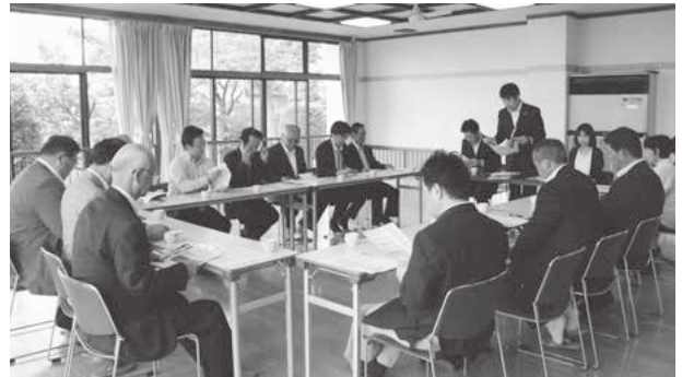
こども園で説明を受ける議員

こども園は幼稚園が行う「幼児教育」と保育園が担う「保育」の両方の役割を持つ施設です。西こども園は幼稚園・保育園の両園舎を活用し217人、東こども園は保育園舎を活用し78人が通園しています。子どもの過ごし方についても、年齢ごとにさまざまな工夫がされていました。0～2歳児については保育園と同じような過ごし方をしますが、3～5歳児については1日4時間程度を教育時間として設定しています。また世代の違う子ども同士が交流を通して、成長し合える環境が整っています。一般的な幼稚園では3歳から就学前までの園児が利用しますが、こども園は0歳の園児から入園が可能で年齢の離れたお友達と交流することができます。年上や年下のお友達との交流を通して体力、知力、そして