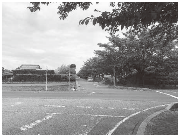
この先が行き止まりだとわかりにくい状況になっている

町長 なかさと公園の堤防側の側道が行きどまりで車の方向変換をすることが難しい。看板の位置変更などの対策は。 町長 来場者に対して親切なおもてなしを念頭に、当該道路に進入する手前に看板の場所を変更します。また、来年度の利根川水系連合・総合水防演習では利根川河川敷の利活用を念頭に、何らかの形で通り抜けができるよう要望したいと思っています。