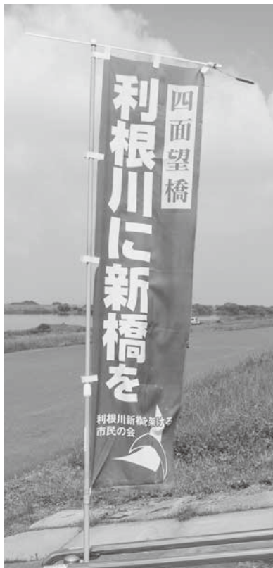
利根川新橋早期建設へ向けた市民団体の活動