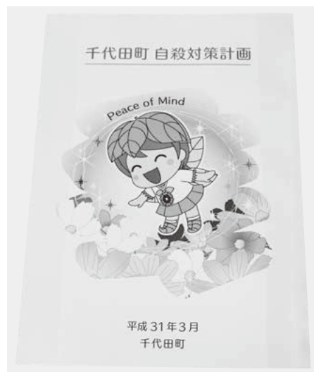
汎用性の高い対策計画です

組みながら進める必要があり。本町においても関係所管と連携を密にして取り組む必要があると考えます。