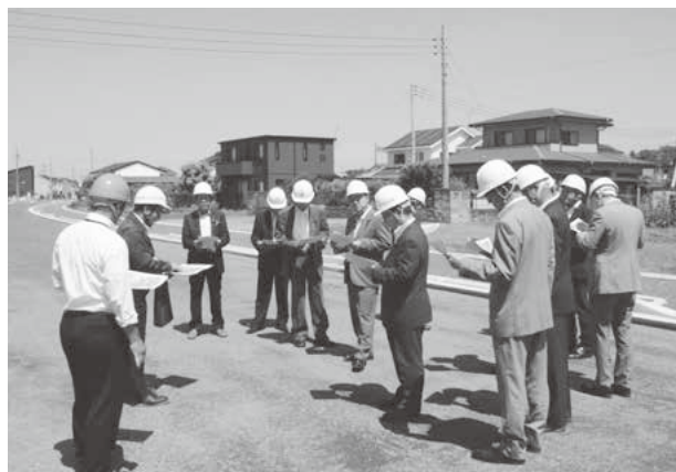
都市計画道路工事現場での現地視察

国道も鉄道も通っていない本町なので、せめて東西南北の道路整備は一刻も早く実現してもらい、近隣の市町から来やすく、近隣市町へ行きやすくすることが必要と思います。町長は日頃より議員の質疑