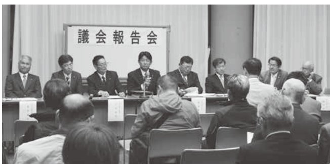
昨年の議会報告会

期日：令和元年11月9日（土）午後6時30分から 場所：千代田町民プラザ 1階 講義室 目的：町民と議員が町政全般にわたり情報及び意見を交換します。