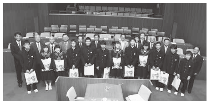
町議会議員と昨年の子ども議員

期日：令和元年11月6日（水）午後2時から 場所：千代田町役場 3階 議場 目的：中学生の社会科の生きた勉強と、子どものまちづくりへの考えを参考にします。