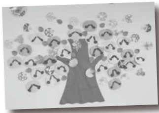
こども園園児の作品