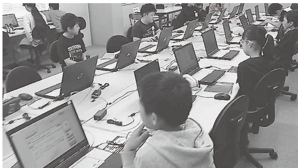
コンピュータを使った授業風景

問 ICT環境の整備状況は。 教育長 各学校のコンピュータ教室に40台ずつパソコンを設置しています。タブレットも段階的に導入しており、東小学校23台、西小学校25台、中学校に13台を導入済みです。