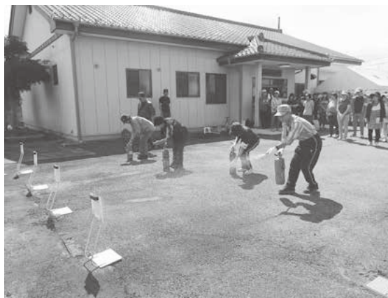
実際に消火器を使った消火訓練

「自分の身は自分で守る」、「逃げる」ということと、近所で助け合うことが大切です。