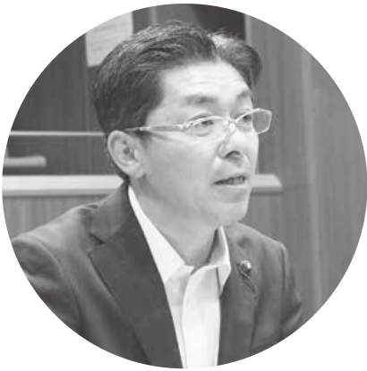
大澤 成樹議員 NARUKI OSAWA