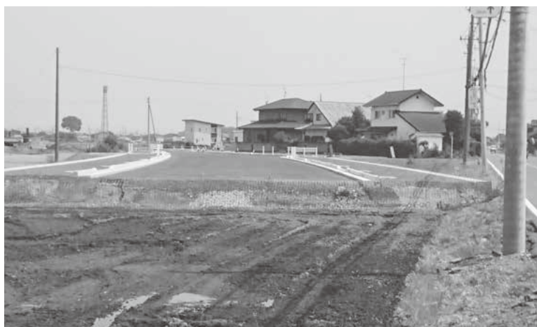
接続が待たれる都市計画道路(舞木地内)