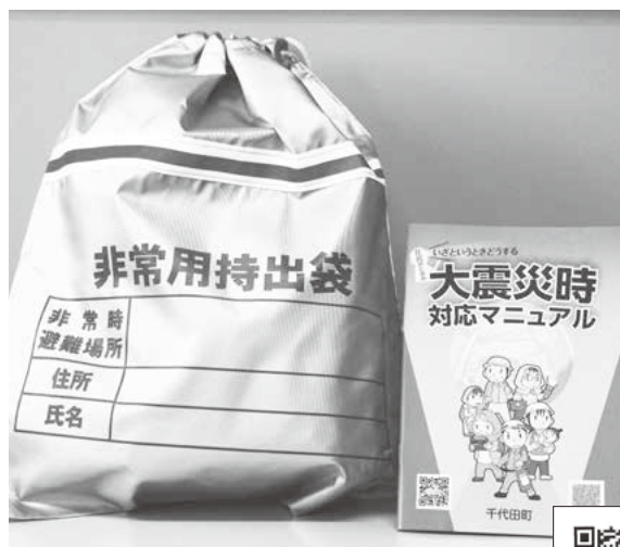
町制35周年で每户配布された 非常用持出袋と大震災時対応マニュアル

町長 児童・生徒に備蓄品を購入してもらう考えはないです。家庭で事前に準備をしてもらうのが一番良いと考えています。