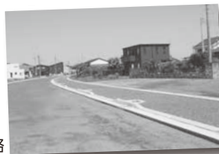
工事が順調に進む都市計画道路