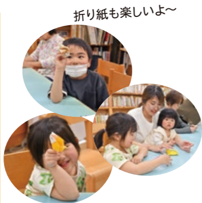
折り紙も楽しいよ～