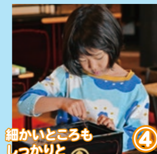
④ 細かいところもしっかりと