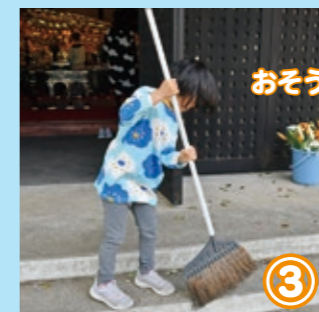
③ おそうじ頑張るよ!