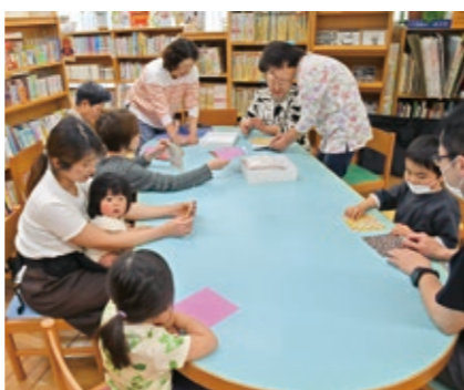
読み聞かせの後は、折り紙やペーパークラフトなどをします