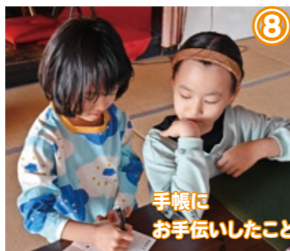
⑧ 手帳にお手伝いしたことを書くよ

本を読むのが好きで、山屋記念図書館によくいきます。本をたくさん読むとスタンプがもらえるのも嬉しいです。町の面白いイベントに参加するのも嬉しいです。