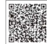
▲気象庁ホームページ