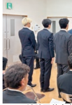
▲消防団辞令交付式