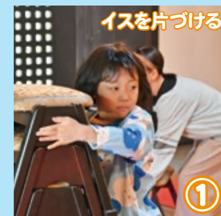
① イスを片づけるよ!