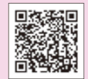
▲県警ホームページ