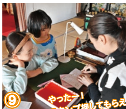
⑨ やったー! スタンプ押してもらえた!

千代田町では、今の子どもたちが社会の中核を担う未来を見据え、「2060年の大人づくり」を掲げています。その実現のため、学校・家庭・地域が緊密に連携し、子どもたちに不足していると言われる実社会での「体験活動」を積極的に推奨しています。その具体的な取り組みとして、平成26年度から東・西小学校全児童に手帳を配布。子どもたちが手帳に記録した一年間の「体験活動」を自ら振り返ることで達成感を得て、自己肯定感を高めます。その