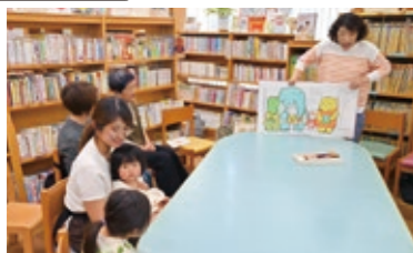
「虹の会」の皆さんによる読み聞かせが、毎月第2土曜日に行われます。ぜひ、お気軽にお越しください。