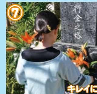
⑦ キレイに生けるよ