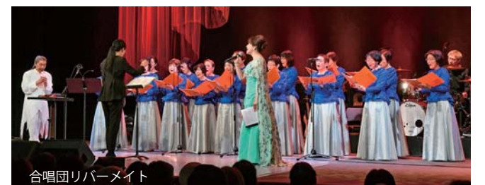
合唱団リバーメイト