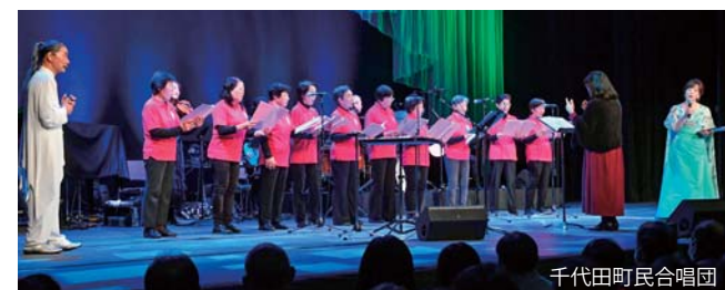
千代田町民合唱団