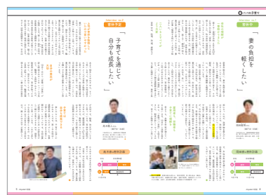
広報紙部門 広報ちよだ11月号