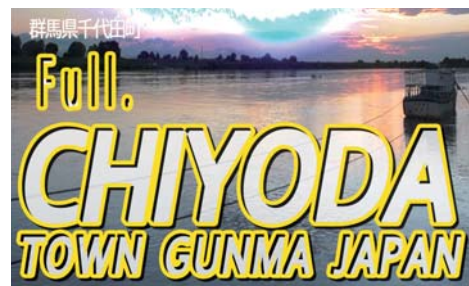
映像部門 千代田町シティプロモーション

令和5年県市町村広報コンクール「映像部門」で、「千代田町シティプロモーション」が「第2席」を獲得。審査員からは「町のプロモーションビデオとして良くできている。さまざまなまちの魅力を満載しており、意外な一面も見えた。利根川や水とともにある町の特徴がよくわかった。映像美もあり、世代間交流の様子もわかり、明るい未来も想起させた」と講評されました。