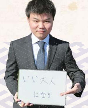
ゲンチュンチクンさん (上五箇)