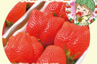
いちご[やよいひめ] 約350g 選べるパック数