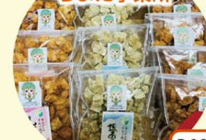
あげもち4種セット (醤油/塩/黒糖/七味)