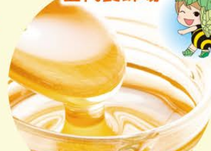
国産百花はちみつ 600g