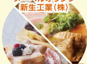
もつ煮セット ドーナツ各種