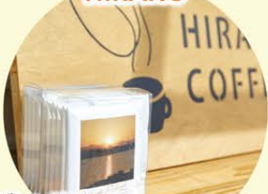
ブレンドコーヒー ドリップバッグ 自家焙煎コーヒー豆