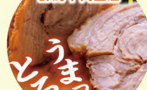
自家製チャーシュー 約800g×1本