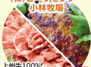
上州牛100% 手こねハンバーグ 上州牛厳選お肉各種