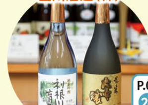
日本酒 清酒[利根川育ち] 地酒2本セット 日本酒 大吟醸清酒[光東] 地酒セット