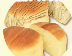
天然酵母パン 24個セット