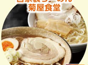
自家製ラーメンセット (塩味/しょうゆ味)