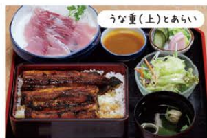
うな重(上)とあらい

当店自慢のうなぎは肉厚で香ばしく、甘辛なタレとのバランスは絶品です。誰でも気軽に寄れるお店です。