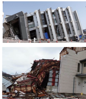
写真：能登半島地震による家屋倒壊

A 平成7年に発生した阪神・淡路大震災では、新耐震基準導入以降に比べて、それ以前（旧耐震基準）に建てられた木造住宅の被害が大きかったと報告されています。この傾向は、熊本地震（平成28年4月）や能登半島地震（令和6年1月）においても顕著でした。