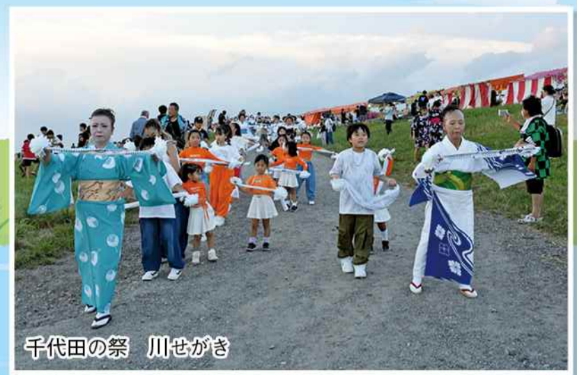
千代田の祭 川せがき