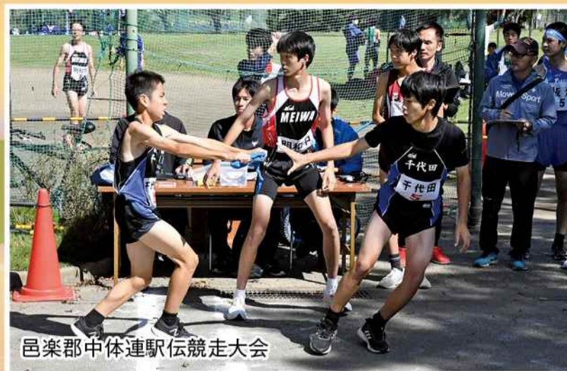
邑楽郡中体連駅伝競走大会