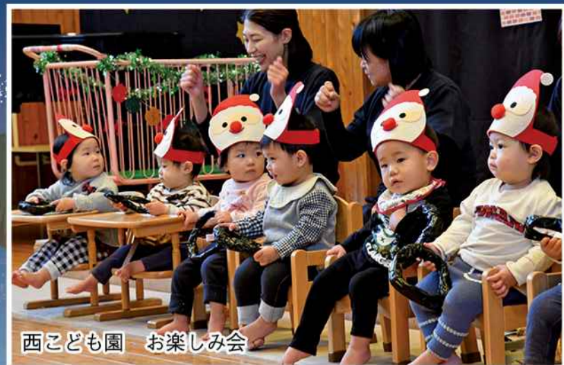
西こども園 お楽しみ会