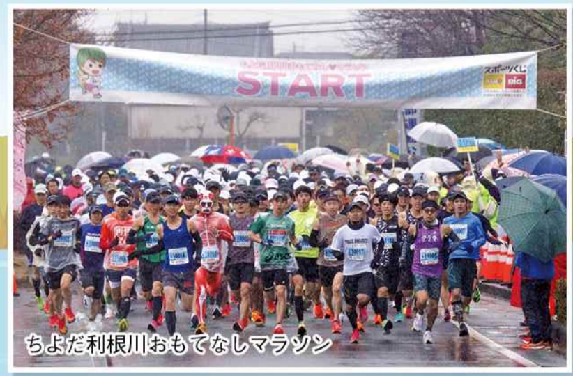
ちよだ利根川おもてなしマラソン