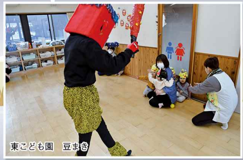
東こども園 豆まぎ