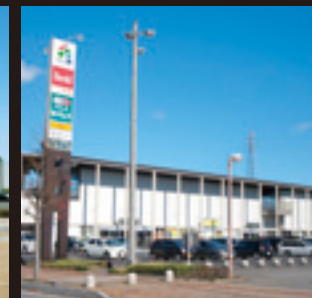
駅周辺のショッピングモール