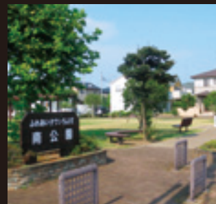
公園と緑に囲まれた快適な暮らし