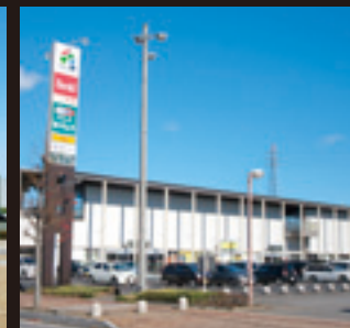
駅周辺のショッピングモール