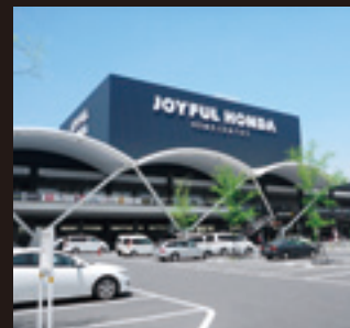
ジョイフル本田千代田店に隣接

※ふれあいタウンちよだは2つのエリアがあり、群馬県企業局と千代田町が分譲しています。