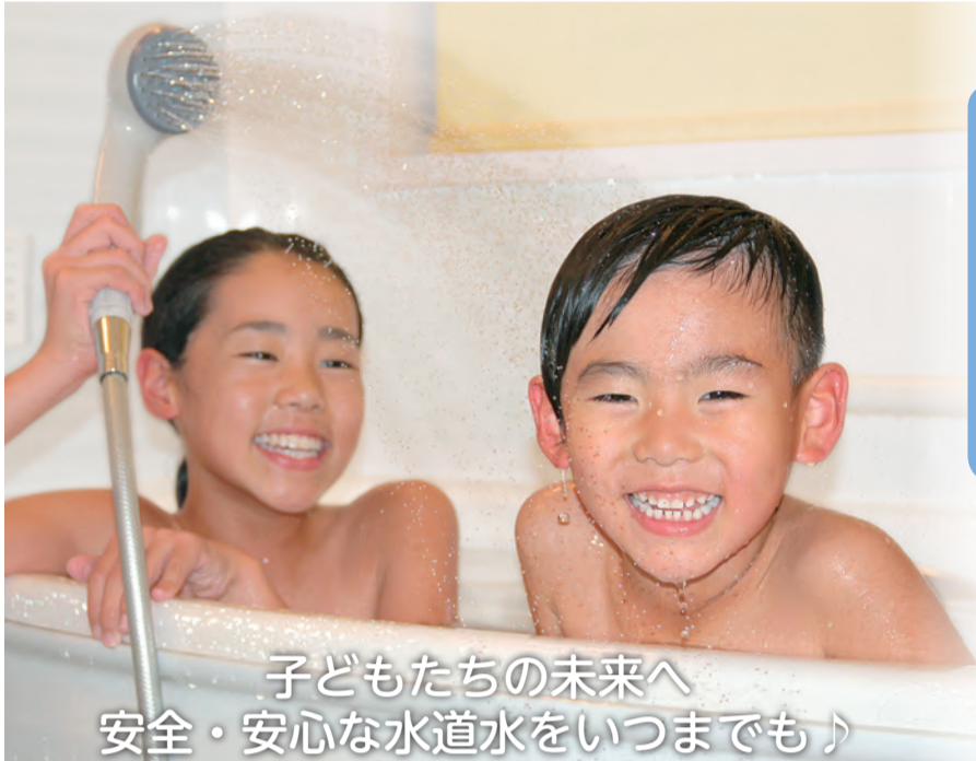
子どもたちの未来へ 安全・安心な水道水をいつまでも♪

発行 群馬東部水道企業団 太田市浜町11-28 電話 0276-45-2731 http://www.gtsk.or.jp