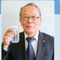
群馬東部水道企業団 企業長 太田市長 清水聖義