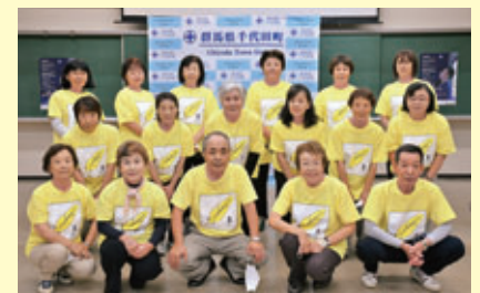
▲町保護司会と町更生保護女性会

「町保護司会」は、啓発のぼり旗の設置、啓発グッズなどを配布。「町更生保護女性会」は、同会の犯罪予防活動に対する町の理解、支援を求めるメッセージ伝達式を行いました。