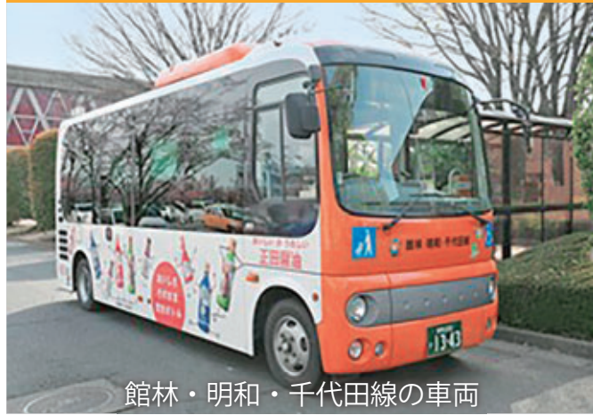
館林・明和・千代田線の車両