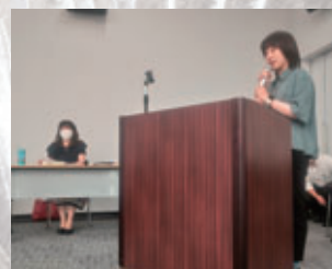
授賞式で参加者を前に事例発表 を行う千代田町産業観光課職員

映像は町の観 光公式インス タグラムや町 YouTubeチャ ンネルでもご 覧になれます。