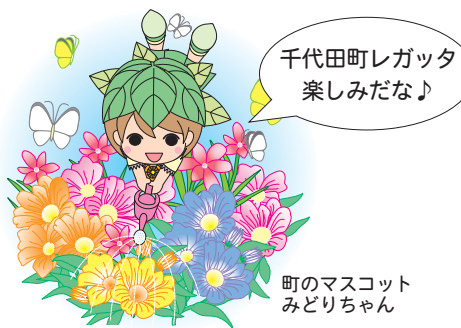
町のマスコット みどりちゃん