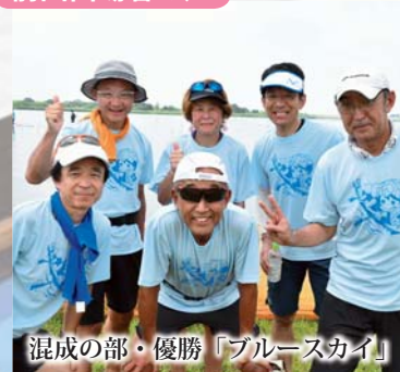
混成の部・優勝「ブルースカイ」