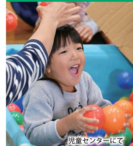
児童センターにて