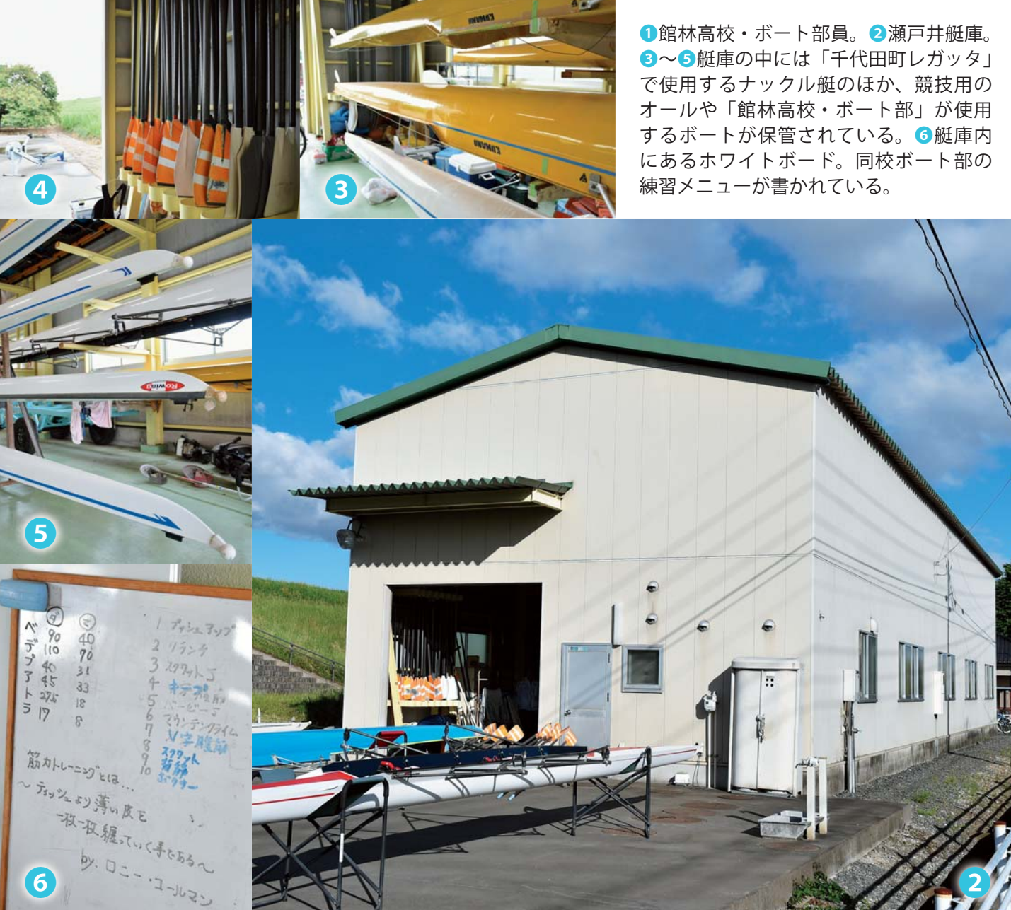
① 館林高校・ボート部員。② 瀬戸井艇庫。 ③～⑤ 艇庫の中には「千代田町レガッタ」 で使用するナックル艇のほか、競技用の オールや「館林高校・ボート部」が使用 するボートが保管されている。⑥ 艇庫内 にあるホワイトボード。同校ボート部の 練習メニューが書かれている。