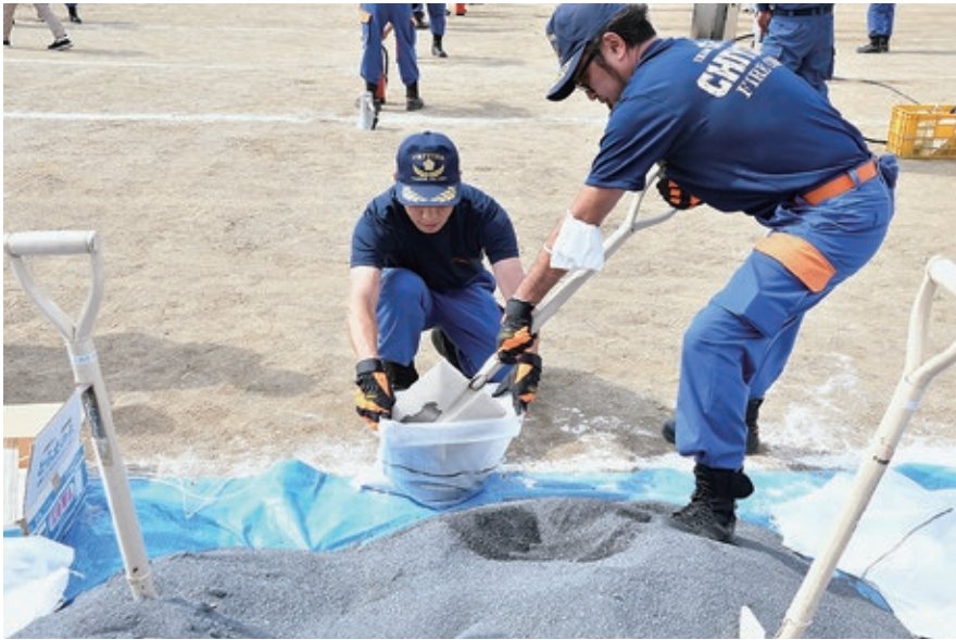
防災訓練で大活躍

令和6年第1回臨時会が、2月20日から29日までの10日間の会期で開かれ、規約変更、条例の制定や改正、令和5年度一般会計補正予算など、承認2件、議案21件、同意1件、発議1件が上程され、慎重に審議を行いました。また、第1回定例会では、発議1件が上程されるなど、慎重に審議を行いました。