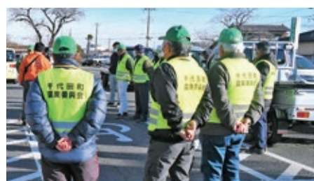
巡回に励む農業委員