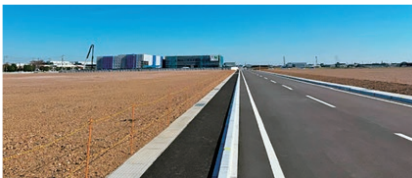
本町の企業立地促進へ