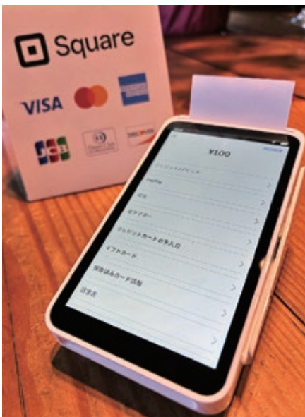
手軽にキャッシュレス