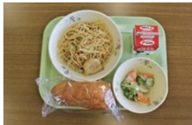
安全安心おいしい学校給食

答 維持管理など経費として、年間約1億円程度かかるので財源の確保や近隣市町との兼ね合いなどを考えると半額補助を継続して行きます。