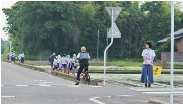
ふれあいタウン上中森南東側の交差点