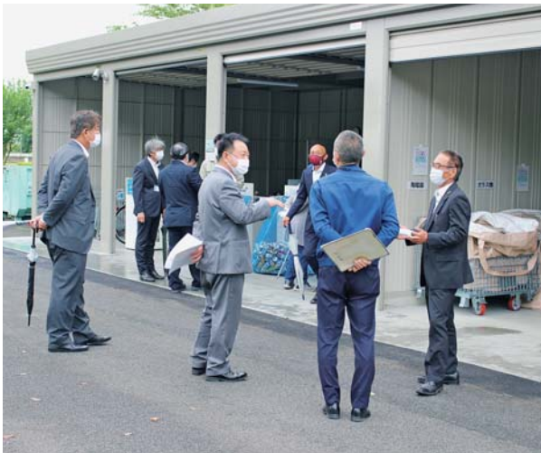
新設されたちよだecoパーク東