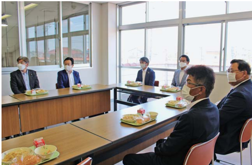
給食センターでの試食

給食センターで、実際に子どもたちに提供されている給食を試食しました。黙食は会話を楽しめませんが、ゆっくりと味わって食事をする事が出来ます。