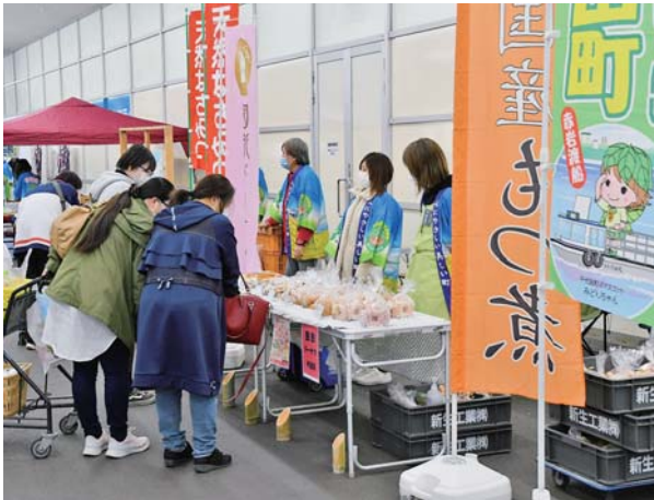
本町を様々なイベントでPR