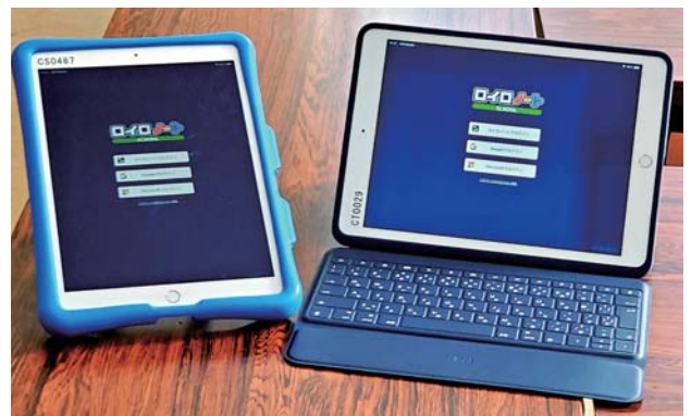
本町の児童生徒が使用しているタブレット

問 コロナ感染第6波では子どもの感染者が増えたことで差別や後遺症など子どもへのケアはどうしたか。