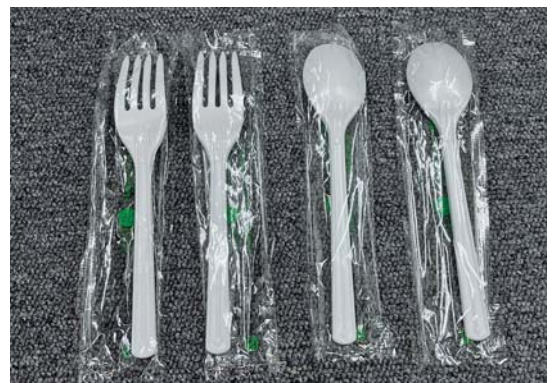
新法でプラ製品の提供方法が変わりました